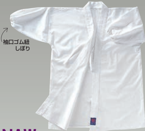
袖口ゴム紐しほり