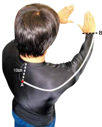
Longueur de A à B (poignet)