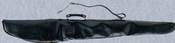
合皮製2振入 大刀用 EFD2 ¥10,260+税 長さ/117cm