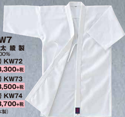
KW7 晒太綾製 綿100% 2号 KW72 ¥3,300+税 3号 KW73 ¥3,500+税 4号 KW74 ¥3,700+税 (日本製)