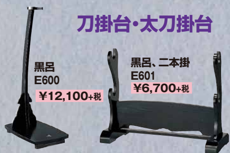
黒呂 E600 ¥12,100+税