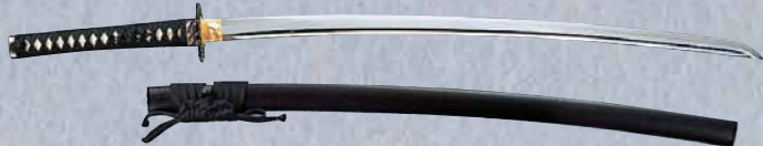
普及品 大刀、石目(2.2~2.45尺) E110 ¥40,600+税 小刀、石目(1.5尺) E111 ¥35,000+税 ※鞘(さや)石目塗 ※刀袋付