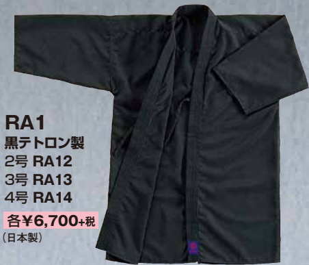
RA1 黒テトロン製 2号 RA12 3号 RA13 4号 RA14 各¥6,700+税 (日本製)