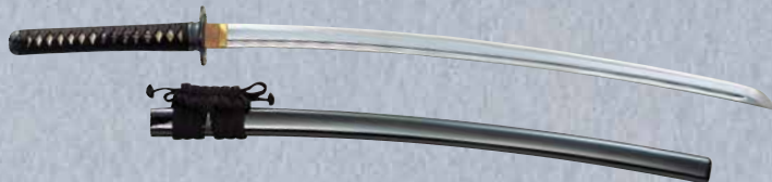
上級品 大刀、同田貫(2.2~2.5尺) E210 ¥109,000+税 小刀、同田貫(1.5尺) E211 ¥106,000+税 ※鞘(さや)黒呂塗 ※刀袋付