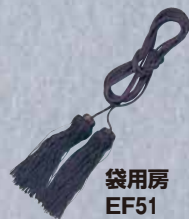
袋用房 EF51 ¥2,200+税