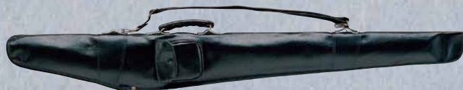
合皮製1振入 大刀用 EFD1 ¥4,300+税 長さ/111cm