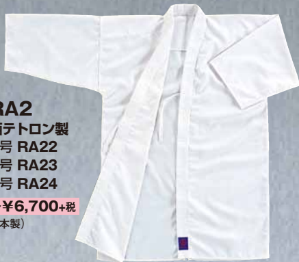
RA2 晒テトロン製 2号 RA22 3号 RA23 4号 RA24 各¥6,700+税 (日本製)